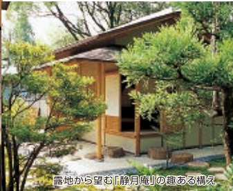
露地から望む「静月庵」の趣ある構え

■茶室のご利用・見学等は管理事務所(TEL 054-251-0016)にご確認ください。