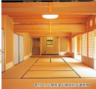
寄付より広間を望む開放的な連続間

日本建築の伝統美と風趣をたたる 数寄屋造りの茶室「雲海」。木の香漂う 心やすらぐ空間は、茶の湯をはじめ、 生け花や句会など、伝統文化に親しみ 未来へと継承していく場として多目的 に利用できます。