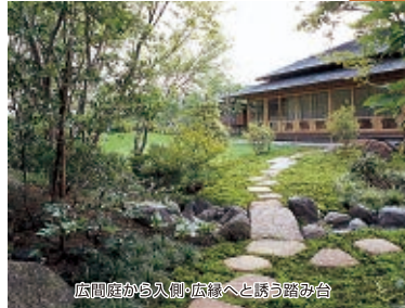
広間庭から入側・広縁へと誘う露み台