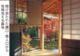
開け放たれた調子・貴人口から 垣間見える露地