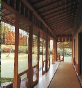
庭の緑と自然光がやさしく差し込む入側