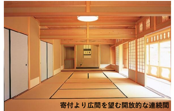
寄付より広間を望む開放的な連続間