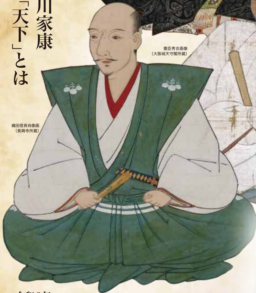
織田信長肖像画 (長興寺所蔵)