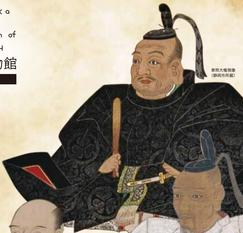
東照大権現像 (静岡市所蔵)