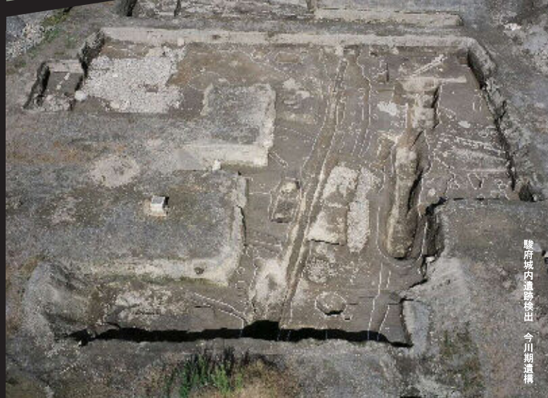
駿府城内遺跡発出 今川期遺構