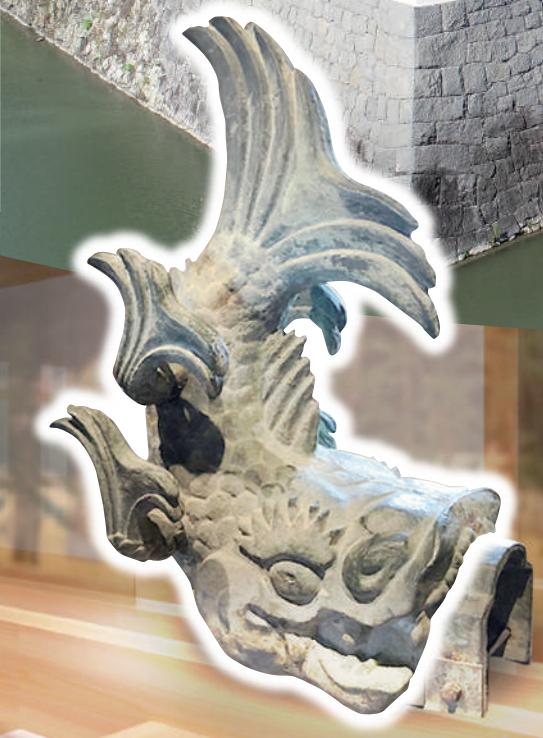
二ノ丸堀から発見された青銅製鯨 (静岡市指定文化財)