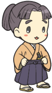
松平竹千代 (後の徳川家康)

徳川家康が竹千代時代に駿府で学んだ部屋を再現した「手習いの間」で学習体験をしよう！