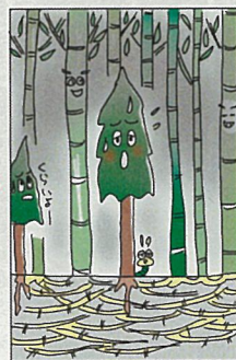
地下の根から周りに 侵入して