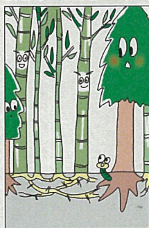
竹が放置されると