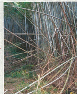
こんなに荒れてしまう……！