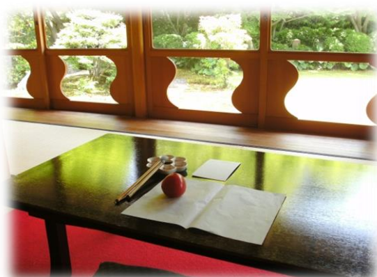
【会場】紅葉山庭園茶室